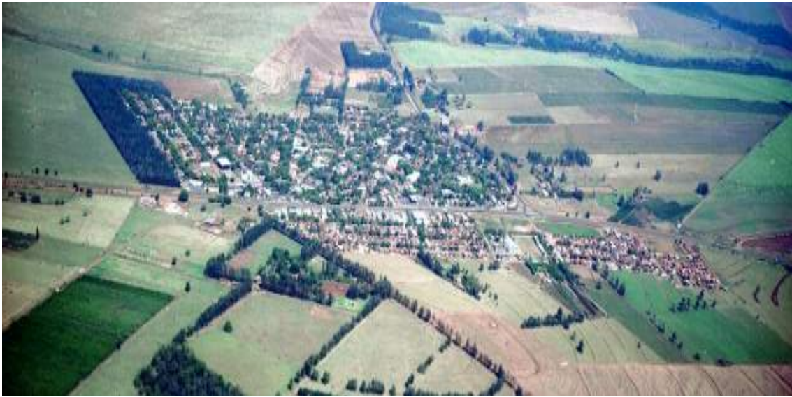
Figura 2 - Vista aérea do município

Fonte: Galeria de Fotos do município de Presidente Castelo Branco-PR 7