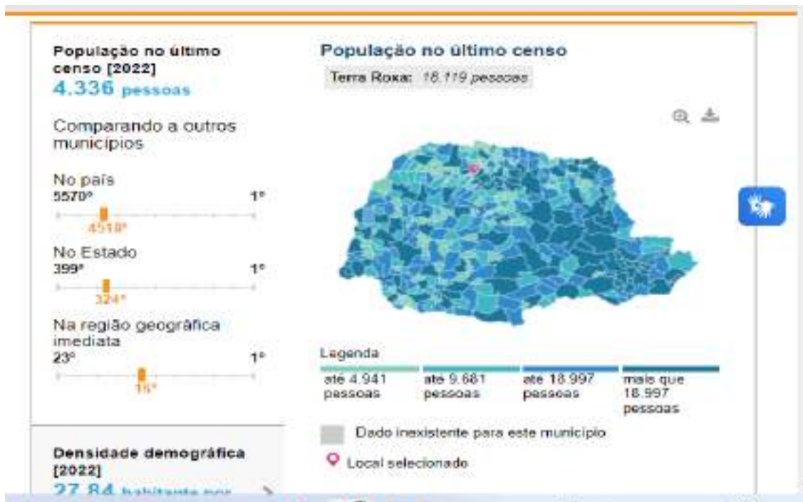
Figura 1 - com dados populacionais e localização no Estado do Paraná

Segundo dados do IBGE (Censo de 2022), atualmente, tem a população estimada de 4.336 habitantes 5 , como podemos perceber nas figuras apresentadas abaixo.